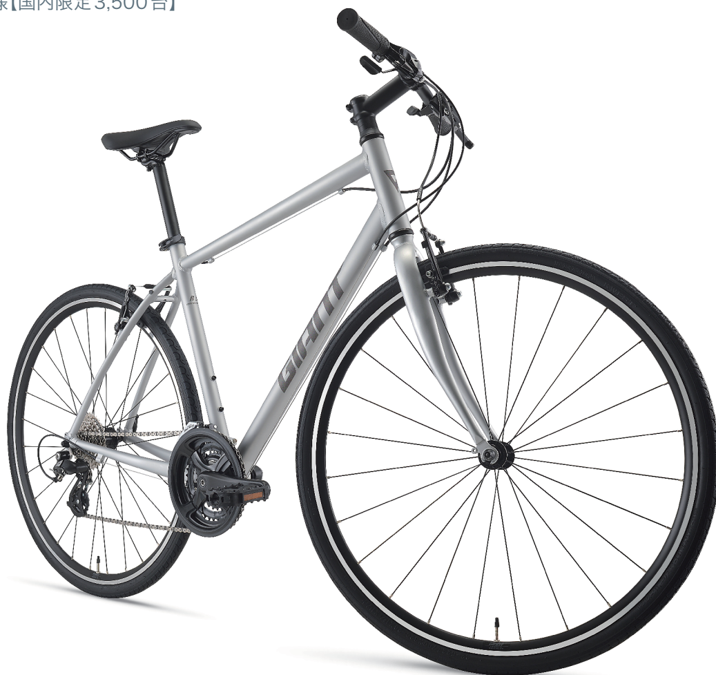
COLOR: マットアルミニウムシルバー

GIANT JAPANの35周年を記念したスペシャルエディションとして、発売から20周年を迎え昨年、第5世代へと生まれ変わった「ESCAPE R3」のスペシャルエディションが登場。フレームカラーは、GIANTの誇る高品質なアルミフレーム製造をイメージし、アルミニウム素材の上質な質感をペイントで再現。デカールには、ライトなどの光を反射するリフレクティブデカールを採用した特別仕様【国内限定3,500台】